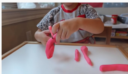
ATIVIDADES PARA COORDENAÇÃO MOTORA FINA - PREPARAÇÃO PARA A ESCRITA - FLÁVIA CALINA