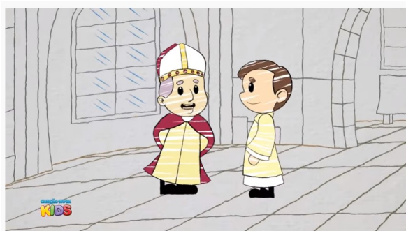
Hora da História - Corpus Christi

135.141 visualizações · 18 de jun. de 2019